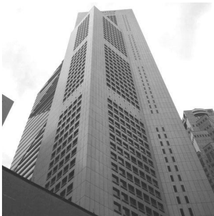
駐在員事務所が入居するオフィスビル外観

シンガポール駐在員事務所は、当面日本からの駐在員2名を含む3名で業務を開始しますが、将来的には現地法人化を検討し、業務内容を順次拡大していく方針です。