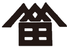
1972 (昭和 47) 年まで用いた社章