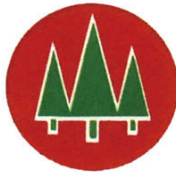
1973 (昭和 48) 年制定。初代社長小川栄一が提唱した創立以来の経営理念「美しき光と木と緑をより多くの人に」を象徴したもの。丸い円の赤は太陽を、中の緑は樹木を表している。